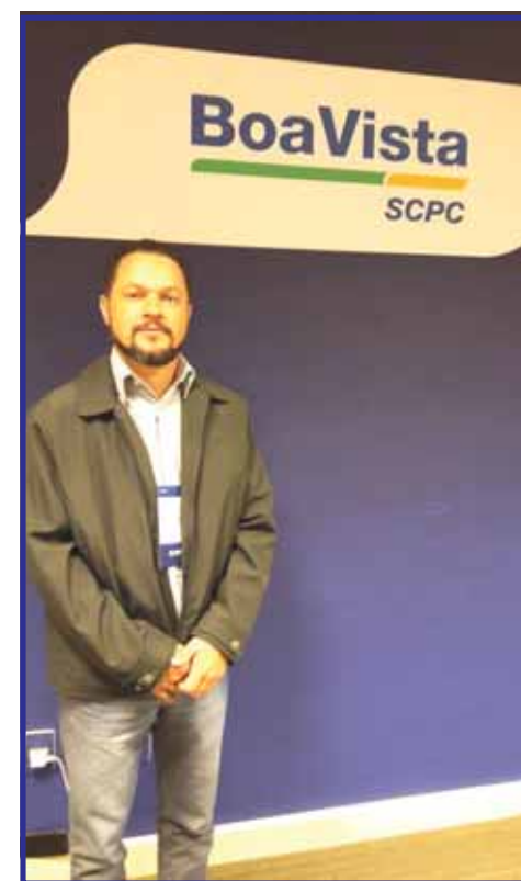
Um forte Abraço!

Pela união, sobrevivemos à mais crítica e extensa crise financeira da nossa história. E pela união, construiremos agora um futuro de prosperidade.